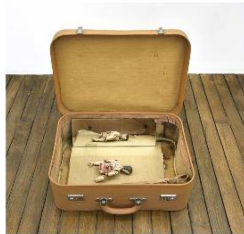
Sergio Verastegui, Where , 2016, valise en cuir et tissu, carton, miroir, statuette en bois peint, 47 x 40 x 50 cm.

comme une menace : « Ce sont des fragments de sculptures baroques péruviennes que j'ai achetés dans un antiquaire à Lima. Il s'agit d'un pillage à la base, car ces objets appartiennent à des églises, mais la sculpture religieuse en Amérique Latine est elle-même un symbole refoulé d'un autre pillage, la colonisation. Elle a laissé des traces durables et inconscientes dans notre rapport à l'espace, au langage, au corps. C'est la construction d'un régime de réalité sur un autre, d'une église sur un temple, d'une peau sur une autre », ajoute-il. Sur une toile laissée brute, l'artiste écrira en langue ocaïna, qui n'est plus parlée que par une dizaine de personnes en Amazonie : « un espace dans un espace dans un espace ». La résistance par le langage.