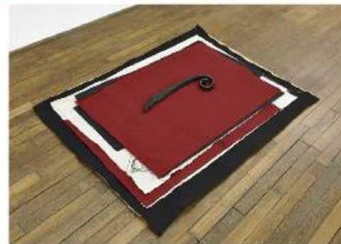
Sergio Verastegui, amuleto (1) , 2016, tissu, toile, carton, bronze, 139 x 106 x 5 cm. © l'artiste et de la galerie Thomas Bernard.

SUITE DE LA PAGE 10 Les mesures du corps de l'artiste. « Les membres fantômes me disent que notre corps est dans le cerveau : il est une construction mentale que mes boîtes-miroir démultiplient en assumant son impossibilité », souligne-t-il. Dans ces boîtes évoquant des cercueils, il place des matières qui peuvent faire allusion à des rites de passage remontant à l'art égyptien et prennent un caractère animiste, analogue à la condition fétichiste de l'art. « Comment peut-on donner du sens à des restes ? Il y a un lien entre la mort et le langage qui lui donne une matérialité », dit-il. Dans l'une de ses boîtes-miroirs, il peut ainsi associer une tête de serpent sur un masque de sommeil, ou mouler dans le bronze une patte de lézard porte-bonheur avec une volute de ferronnerie.